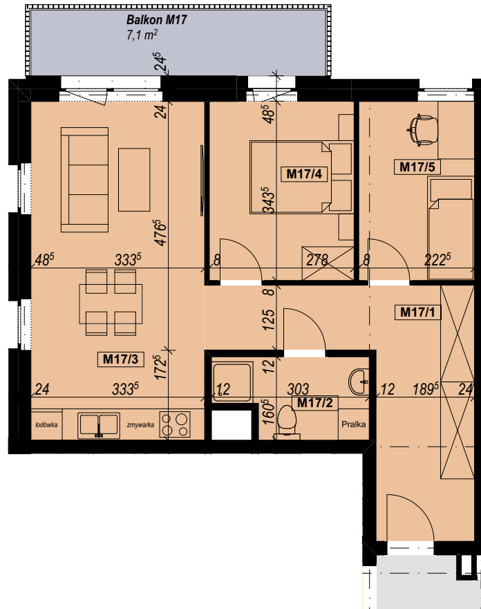
RZUT MIESZKANIA 1:100